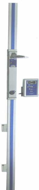
Фотография общего вида РЭС