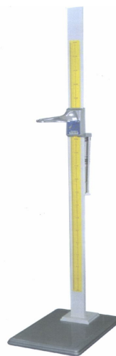
Фотография общего вида РП